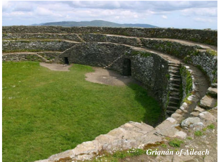
Grianán of Aileach

Unsere Fahrt durch ausgedehnte Torfgebiete bringt uns anschließend in den Glenveagh National Park . In einem dramatisch schönen, von sich zurückziehenden Gletschern